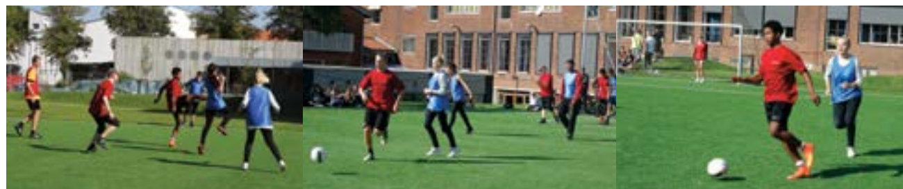
Fotos fra de indledende kampe.