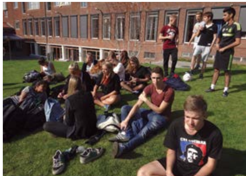
Der blev kigget, heppet og hygget.

Niveauet var højt. Umiddelbart så højt, at lærerholdet, der indtræ-