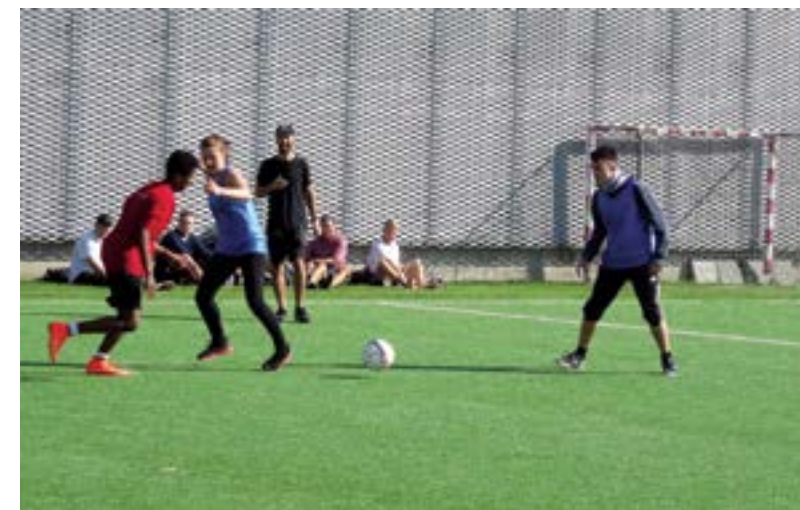
Skoleårets fodboldturnering blev skudt i gang i solskin.

der senere i turneringen, skal tage sig sammen for at slå selv 1. hf'erne.