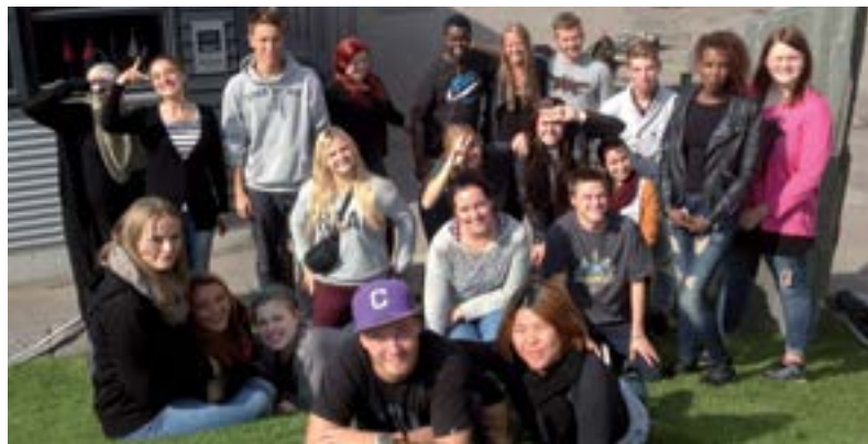
Her ser du et udsnit af kursistrådet 2014.

Du kan altid kontakte Kursistrådet via Efterslægtens Facebook-side.