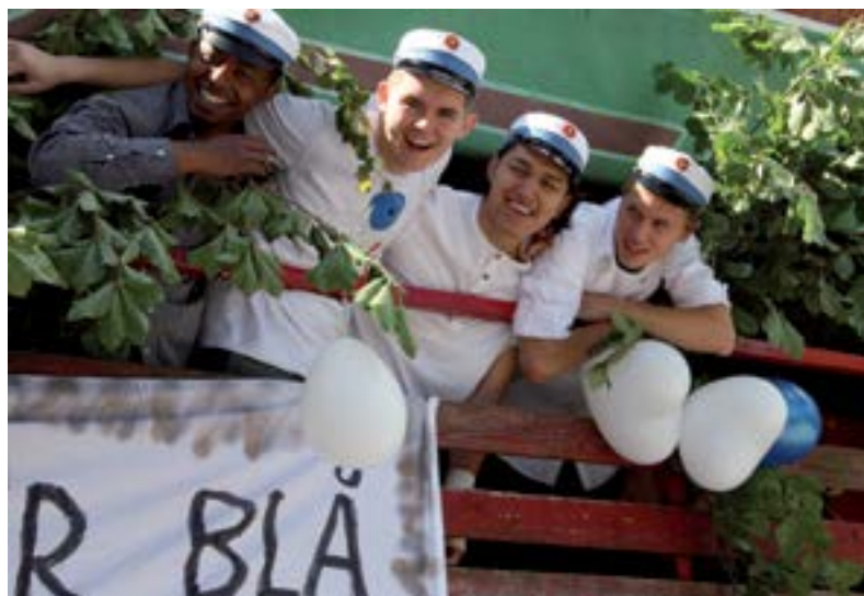
Skal netop DIN klasse vinde vognen til studenterkørslen?

Tilmelding til vognkonkurrencen skal ske via e-mail til mj@hfc.dk .