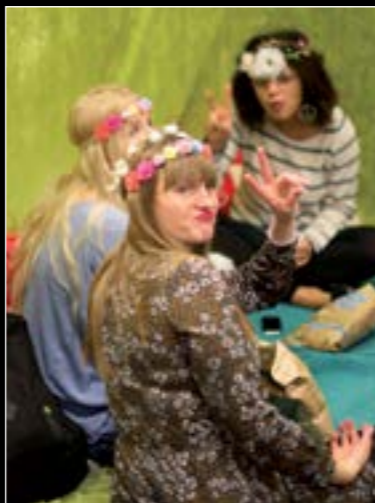
"I have a dream" - Martin Luther King