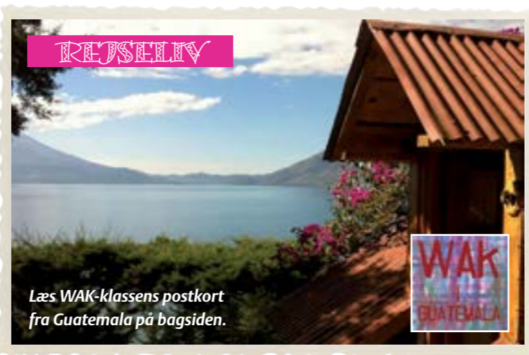
Læs WAK-klassens postkort fra Guatemala på bagsiden.

Deadline for indlæg til næste nummer: tirsdag d. 24. marts. Send til mn@hfc.dk