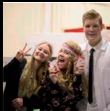
Hipsters, hippies og playboys